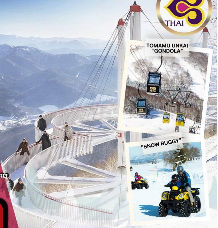
TOMAMU UNKAI "GONDOLA"