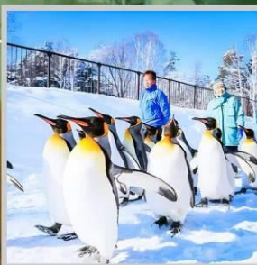
"PENGUIN ASAHIYAMA ZOO"