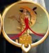
วัดหวังต้าเซียน วอพรความรัก