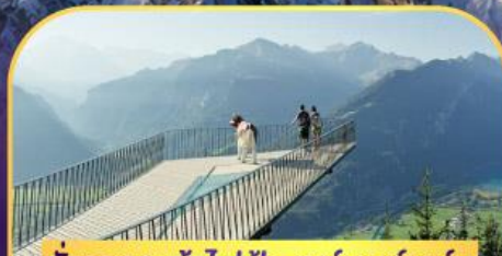
นั่งรถกระเช้าไฟฟ้า ฮาร์เตอร์ คูลัม