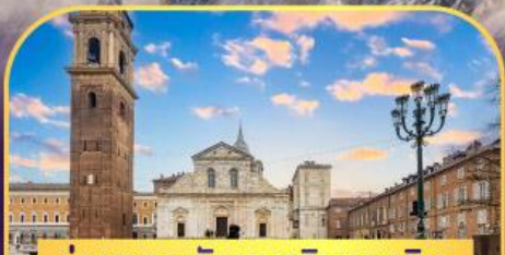
ถ่ายภาพกับมหาวิหารตูริน