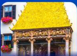
หลังคาทองคำ อินส์บรุค