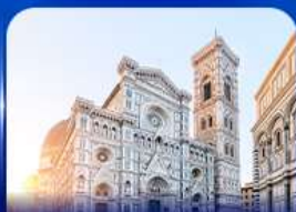
ชมเมืองแห่งศิลปะ ฟลอเรนซ์