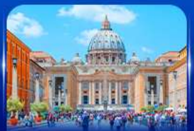
นครรัฐวาติกัน โรม