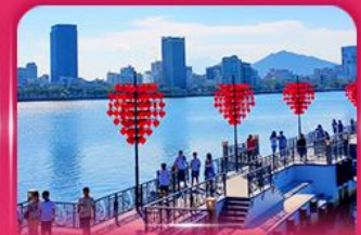
สะพานแห่งความรัก