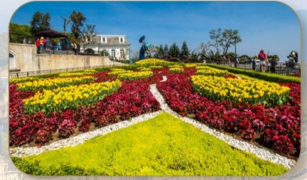
สวนดอกไม้ Le Jardin D'Amour