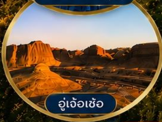
อู่เจ้อเซ้อ