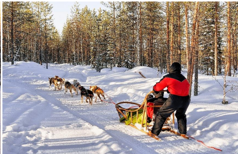
DOG SLEDDING ADVENTURE