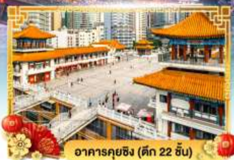
อาคารคุยซิง (ดึก 22 ชั้น)