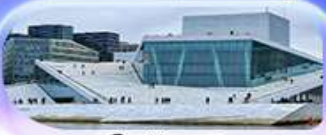
โอเปร่าเฮาส์

07-15 ต.ค.69 / 16-24 ต.ค.69 13-21 พ.ย. 69 / 04-12 ธ.ค. 69 25 ธ.ค. 69 - 02 ม.ค. 70 (ปีใหม่)