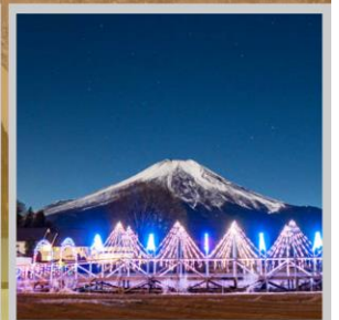
"YAMANAKAKO ILLUMINATION FANTASEUM"