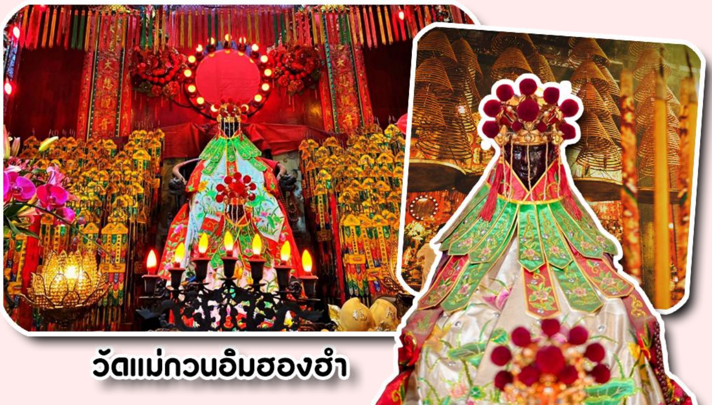
วัดแม่กวนอิมฮ่องฮ่า

พาท่านเดินทางไปที่ ไหว้ขอพรขอเงิน วัดแม่กวนอิมฮ่องฮ่า วัดเก่าแก่ของฮ่องกงสร้างตั้งแต่ปี ค.ศ. 1873 เป็นวัดขนาดเล็กที่มีชาวฮ่องกงศรัทธาแน่นถือกันเป็นอย่างมาก วัดแห่งนี้เป็นที่ประดิษฐาน องค์เจ้าแม่กวนอิมฮ่องฮ่า ที่มีชื่อเสียงเรื่องการให้กู้ยืมเงิน เชื่อกันว่าท่านช่วยพลิกฟื้นเศรษฐกิจของชาวฮ่องกง ผู้คนจึงนิยมมาขอยืมเงินทำธุรกิจจนสำเร็จร่ำรวย รุ่งเรือง โดยให้ท่านอธิษฐานขอพรต่อหน้าเจ้าแม่กวนอิมฮ่องฮ่า พร้อมกับระบุวันเวลาในการขอพรด้วย จากนั้นนำธูปธบายตามฐานะและศรัทธาที่เราจะนำเป็นสื่อในการขอพร เขียนจำนวนเงินที่ต้องการลงไปด้วย ใส่สกุลเงินยิ่งดีใหญ่ แล้วนำเงินใส่ในซองแดง ควรเตรียมซองแดงไปเอง นำซองแดงไปวางรอบกระถางรูป วนขวาจำนวน 3 ครั้ง แล้วเก็บซองแดงในกระเป๋าสตางค์ เป็นเงินขวัญถุง ถ้าประสบความสำเร็จตามที่มุ่งหวังให้นำเงินในซองแดงทำบุญหยอดตู้ที่วัดแห่งนี้ในโอกาสต่อไป วิธีไหว้ให้ปัง ให้ได้โชคลาภเงินทอง ต้องไปกับเราเท่านั้น