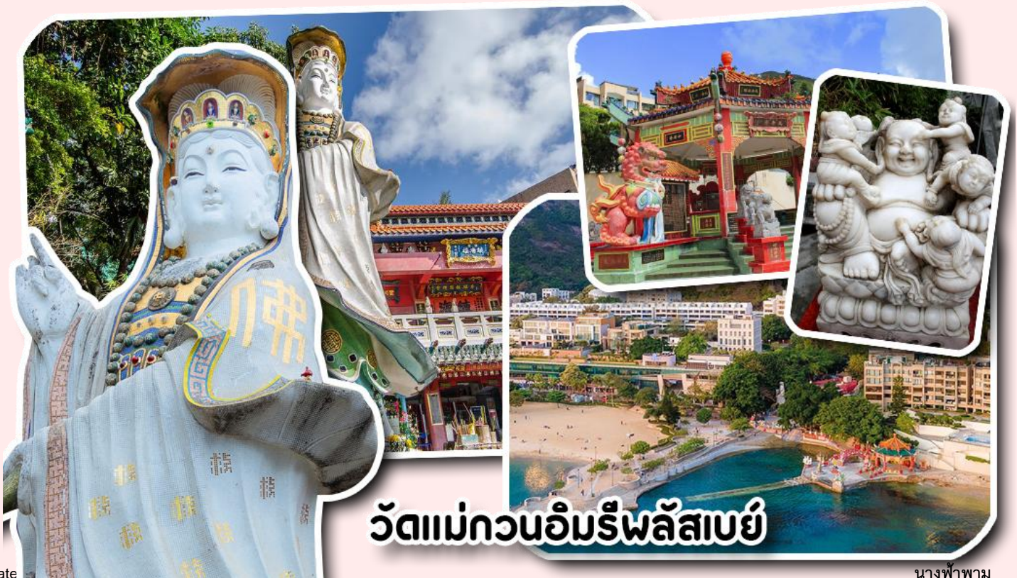
วัดแม่กวนอิมรีพลัสเบย์

จากนั้นพาท่านเดินทางไปนมัสการ เจ้าแม่กวนอิมริมหาดรีพลัสเบย์ วัดแห่งนี้ถูกสร้างขึ้นเพื่อคุ้มครองชาวประมงเวลาออกเรือไปหาปลาในสมัยก่อน บริเวณวัดมีสิ่งศักดิ์สิทธิ์มากมาย ได้แก่ เจ้าแม่กวนอิม ประดิษฐานอยู่ทางด้านซ้ายของวัด ซึ่งผู้คนนิยมเดินทางไปกราบไหว้ขอพรเรื่องการมีบุตร และยังมีพระสังกัจจายที่เชื่อกันว่าสามารถขอเพศของบุตรที่จะมาเกิดได้ โดยหลังจากกราบไหว้แล้วก็ให้ลูบที่ท้องของพระสังกัจจาย ถ้าอยากได้ลูกชายให้ลูบท้องซ้าย อยากได้ลูกสาวให้ลูบท้องขวา ถัดมาคือ เจ้าแม่ทับทิมเทพีแห่งท้องทะเล ท่านจะคอยคุ้มครองผู้เดินทางทางเรือ หรือผู้ที่เดินทางไปไหนมาไหนท่านจะคอยคุ้มครองให้ปลอดภัย และมีโชคลาภ ถัดจากบริเวณที่กราบไหว้ขอพร ก็จะมีศาลาแปดเหลี่ยมริมน้ำ และสะพานเล็กๆ ที่ชื่อว่าสะพานต่ออายุ ซึ่งเชื่อกันว่าหากเดินข้ามสะพานแห่งนี้ 1 ครั้ง ก็จะมีอายุยืนขึ้น 3 ปี