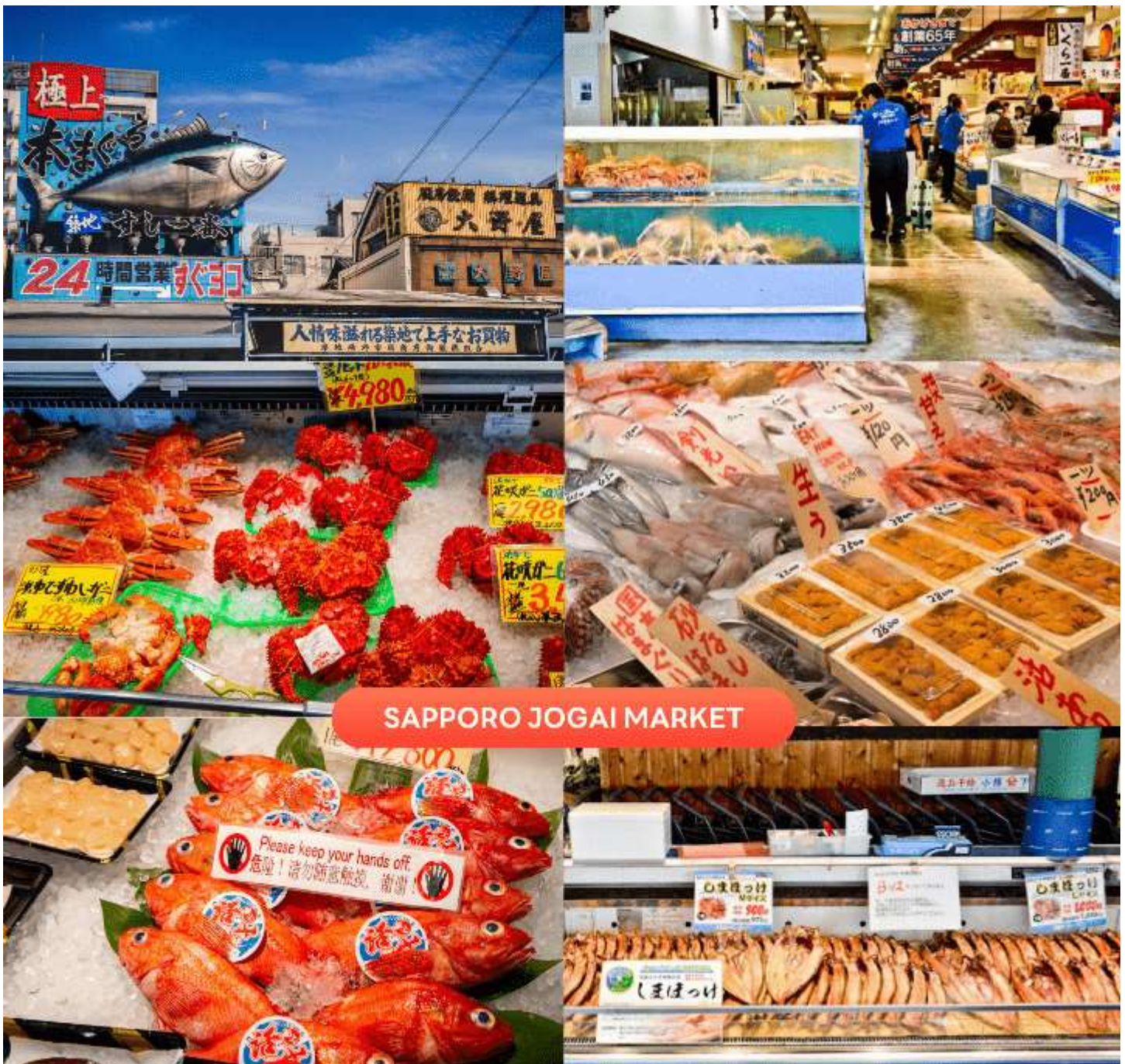
SAPPORO JOGAI MARKET

นำท่านสู่ ตลาดปลาโจไก หรือ ตลาดซัปโปโรโจไก (Sapporo Jogai Market) เป็นหนึ่งในตลาดขายส่งที่ใหญ่ที่สุดในเมืองซัปโปโร ทุกเช้าจะมีผัก ผลไม้และของทะเลสด โดยเฉพาะปลาและปู จากทั่วเมืองฮอกไกโดมาส่งที่ตลาดนี้ในตอนเช้าของทุก ๆ วัน นอกจากนี้ยังมีร้านอาหารที่ใช้ของทะเลสด ๆ เป็นวัตถุดิบหลัก จึงทำให้นักท่องเที่ยว มาเลือกซื้อของทะเลสด ๆ เป็นของฝาก และชิมอาหารทะเลสด ๆ จากร้านอาหารที่นี้อีกด้วย