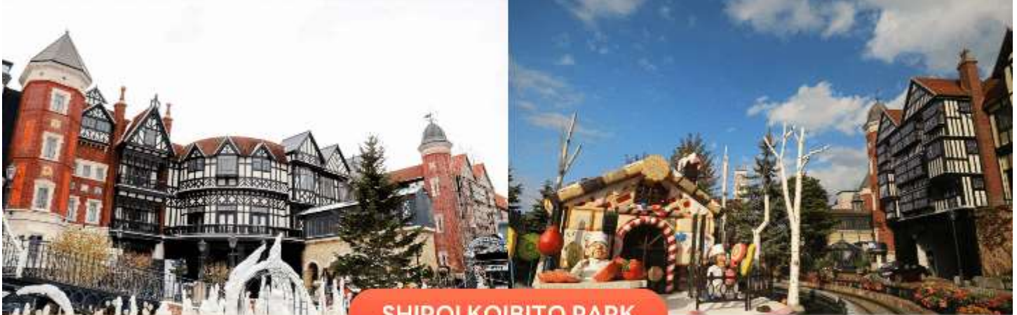
SHIROI KOIBITO PARK