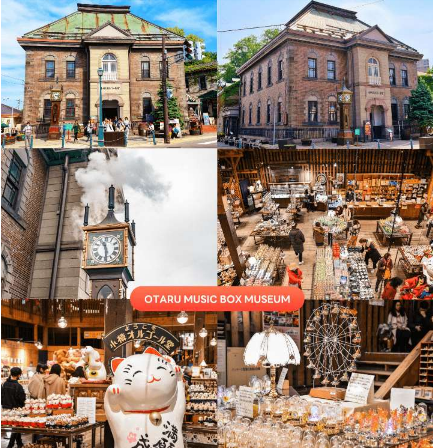
OTARU MUSIC BOX MUSEUM

นำท่านชม พิพิธภัณฑ์กล่องดนตรี (Otaru Music Box Museum) ตั้งอยู่ภายในอาคารเก่าเมืองโอตารุ บริเวณด้านหน้าอาคารมีหอนาฬิกาขนาดใหญ่ที่ทางรัฐบาลแคนาดามอบเป็นของขวัญให้กับรัฐบาลญี่ปุ่น ด้านในอาคารมีกล่องเสียงเพลงมากมาย หลากหลายรูปแบบให้ท่านได้ช้ชม มีการจัดแสดงกล่องดนตรีโบราณและหลากสไตล์กว่า 25,000 ชิ้น อีกทั้งยังมีส่วนจัดแสดงตุ๊กตาคาระกูริ (Karakuri dolls) อันเป็นตุ๊กตาแบบดั้งเดิมของยุคศตวรรษที่ 17 ถึงศตวรรษที่ 19 ที่หาดูได้ยากมาก ๆ ให้ได้ชมอีกด้วย ส่วนใครที่ติดใจอยากได้กล่องดนตรีกลับบ้านแล้วละก็ไม่ต้องเสียใจไป เพราะที่นี่ยังมีส่วนที่เป็นร้านจำหน่ายกล่องดนตรีแบบสั่งทำตามใจจะเอาตุ๊กตาดัวไหน สีอะไร เพลงอะไร สั่งได้ไว้เป็นของที่ระลึก แบบไม่เหมือนใครกันอีกด้วย