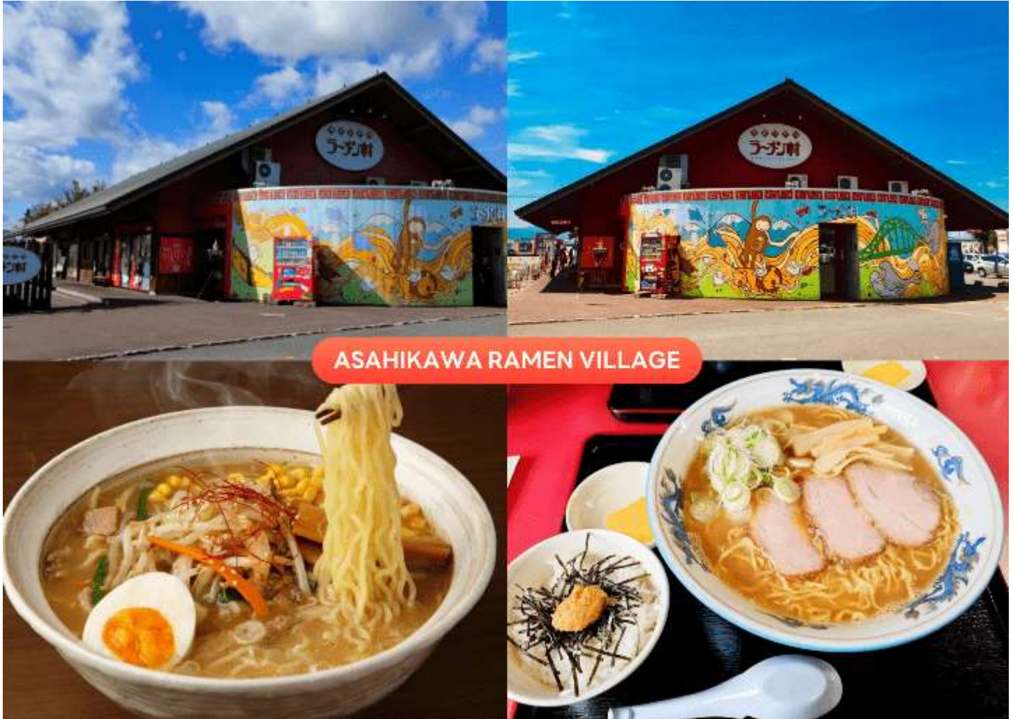
ASAHIKAWA RAMEN VILLAGE

นำท่านเดินทางกลับสู่ เมืองอาซาฮิดาว่า (Asahikawa) เพื่อนำท่านสู่ หมู่บ้านราเมนอาซาฮิดาว่า (Asahikawa Ramen Village) แหล่งรวมราเมนเจ้าดังของเมืองอาซาฮิดาว่า ที่คัดสรรร้านยอดนิยมไว้ถึง 8 ร้านในทีเดียว เพลิดเพลินกับการลิ้มลองราเมนสูตรต้นตำรับฮอกไกโด สไตส์ชุปโซยุที่ขึ้นชื่อเรื่องความหอมกลมกล่อม พร้อมเลือกชิมแต่ละร้านได้ตามใจ อีกทั้งยังมีโซนขายของที่ระลึก และพิพิธภัณฑ์เล็ก ๆ ให้ได้เรียนรู้ประวัติราเมนอีกด้วย