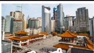
ตึกขุยซิง

พระแกะสลักหินต้าจู้ - หลุมฟ้าสะพานสวรรค์ - เขานางฟ้า ตึกขุยซิง - ตึกตะเกียบ หมู่บ้านโบราณฉือซีไห่