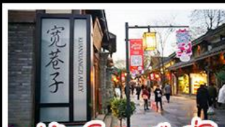
หมู่บ้านโบราณฉือซีไห่