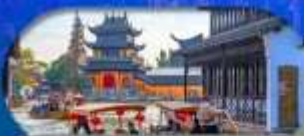
Zhujiajiao Ancient Town ล่องเรือเมืองโบราณ

เซี่ยงไฮ้ ดิสนีย์แลนด์ เมืองโบราณจูเจียเจียว