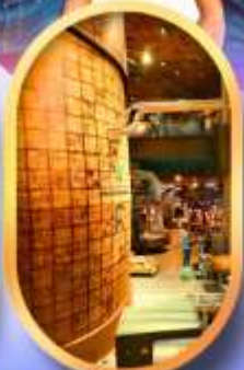
ร้านสตาร์บักส์