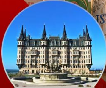
คฤหาสน์เวินเจียง