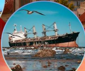
เรืออู่ปาง Blueways