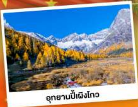
อุทยานปี้ฝิงโกว