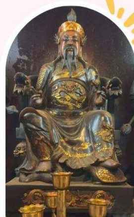
วัดกวนไท ความซื่อสัตย์ เงินทอง ธุรกิจมั่นคง