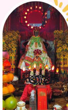
วัดเจ้าแม่กวนอิมฮ่องฮำ ขอพรเรื่องเงิน ทรัพย์สิน และความมั่งคั่ง