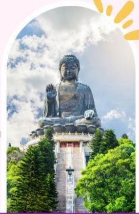
นั่งกระเช้านองปิง นมัสการพระใหญ่โปวหลิน