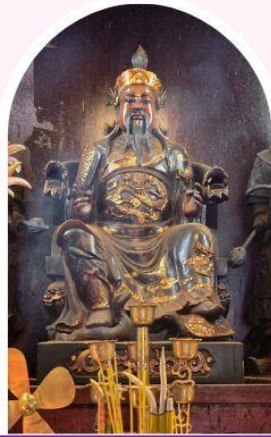
วัดปึกโต เสริมโชคลาภ นำพาความรุ่งเรือง