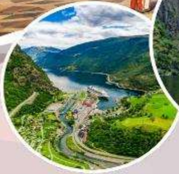
นั่งรถไฟสายโรแมนติก "Flamsbana"