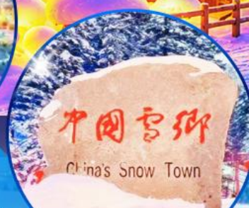
ป้ายหินใหญ่เมืองหิมะ