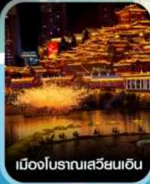
เมืองโบราณเสวียนเอน