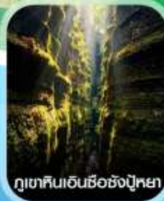
ภูเขาหินเอนช็องซิงปูหย่า

✈️ คอนเฟิร์มออกเดินทาง ทุกพีเรียด 2 ท่านขึ้นไป ✈️