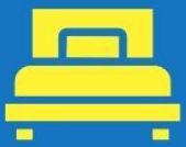
ห้องพักเดี่ยว SINGLE

ตัวอย่างประเภทห้องพัก *เป็นเพียงตัวอย่างเพื่อให้เห็นภาพสำหรับประเภทห้องในแบบต่างๆ